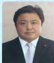
河野 慎一 (民主党 民主)