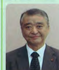
銚子市 鎌倉 金 (東総香取地協 無)