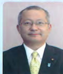
山口 勇 (民主党 民主)