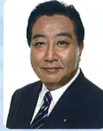
千葉4区 野田 佳彦 (のだ よしひこ) 重点選挙区