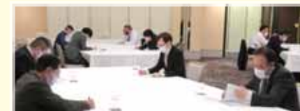
グループ討論の様子

参加者同士の積極的な交流も行われ、リーダーシップについて考える大変有意義な機会となったと思います。来年は、この記事を読んでいる「あなた」の参加をお待ちしています。