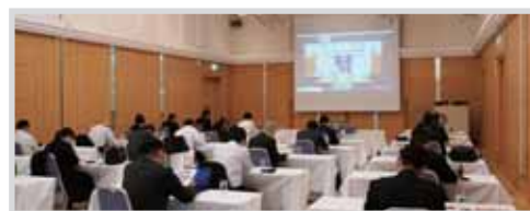
執行委員は別室でリモート参加