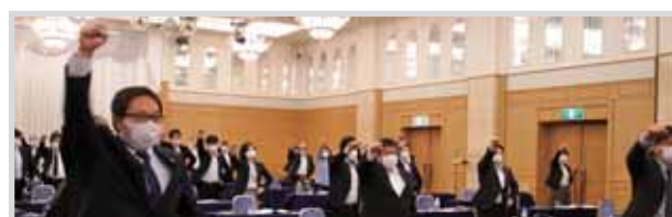
団結して頑張ろう！