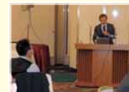
大川氏による講演

http://chiba.jtuc-rengo.jp/siryou_jisedai2020.html