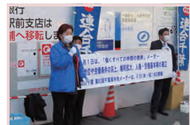
三瓶(議員団)副会長からの呼びかけ