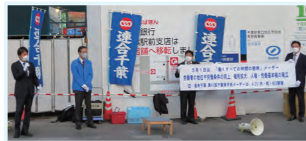
アピール行動の様子