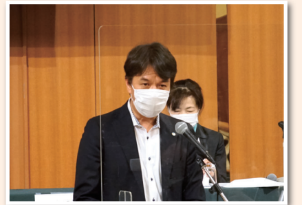
永富会長就任あいさつ

構成組織・地域協議会との強固な連携のもと、働くことを軸とする安心社会の実現に向け、引き続きのご理解とご協力を賜りますようお願い申し上げます。会長就任のあいさつとさせていただきます。ともに頑張りましょう。