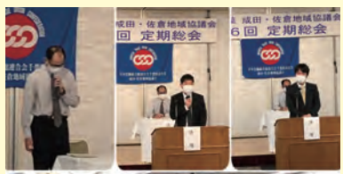
第6回定期総会 【日時】11月24日(水) 16:30~ 【場所】ホテルウェルコ成田