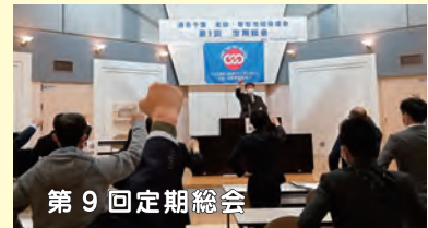
第9回定期総会 【日時】11月26日(金) 19:30~ 【場所】東総教育会館(旭市)