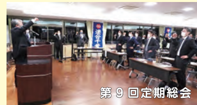
第9回定期総会 【日時】11月9日(火) 18:30~ 【場所】長生教育会館 大会議室