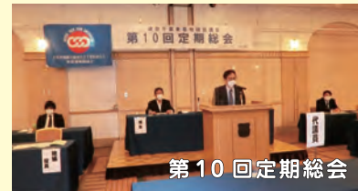
第10回定期総会 【日時】11月19日(金) 18:30~ 【場所】クレストホテル柏