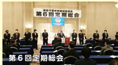
第6回定期総会 【日時】11月12日(金) 18:00~ 【場所】オークラ千葉ホテル