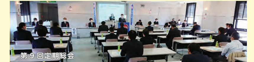
第9回定期総会 【日時】11月20日(土) 10:00~ 【場所】ユニオンセンター君津