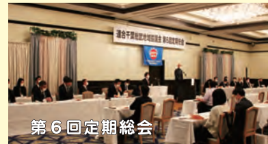
第6回定期総会 【日時】11月19日(金) 18:30~ 【場所】ホテル東京ベイ