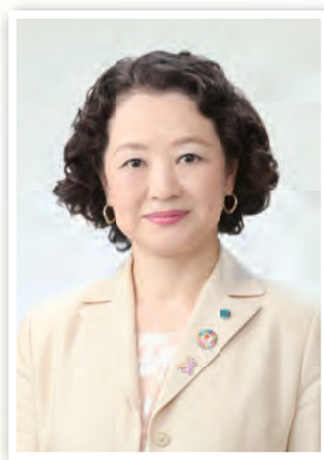
日本労働組合総連合会 会長 芳野 友子

本年も連合に対する一層のご支援をお願いするとともに、皆さまの益々のご健勝とご活躍を祈念いたします。