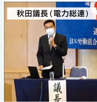
秋田議長(電力総連)