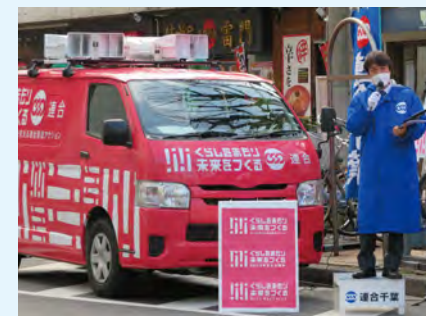
千葉市内の街頭宣伝行動

連合千葉では1月16日(月)～20日(金)の間でラッピングカーによる全国キャラバンを展開、千葉県を一周し生活困窮者支援や賃上げの必要性、物価高騰に対する自治体の取組み等について訴えました。