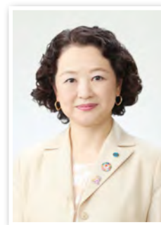
日本労働組合総連合会 会長 芳野 友子

卯年にあやかり、連合運動がより一層、跳躍することができるよう皆さまのご支援をお願いします。本年が皆さまにとって実り多い一年となりますことを祈念いたします。