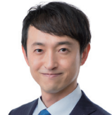
しん みやかわ 伸 みやかわ 伸